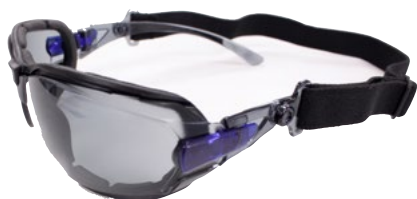
VERSIONE DA SOLE